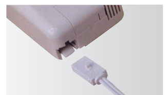
抜け落ち防止プラグ(型式KTS-P531)