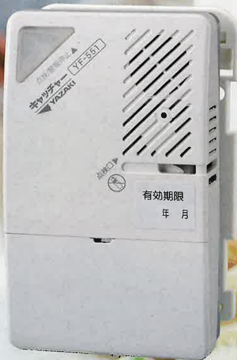
YF-551 都市ガス(空気より重いガス用)