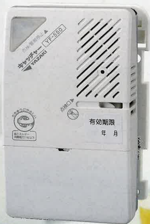
YF-550 都市ガス(空気より軽い12A・13Aガス用)